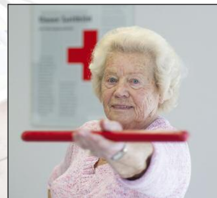
DRK-Gesundheitsförderung auf Zukunftskurs