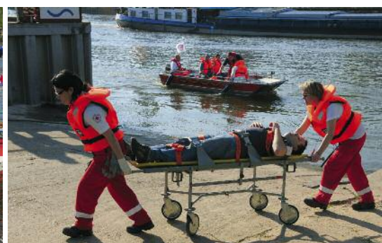
200 Rotkreuzler wirkten bei der „Gateway Cross Challenge“ in Frankfurt mit und retteten zu Wasser und zu Lande.

Namen „Gateway Cross Challenge“: eine gemeinsame Veranstaltung von 200 Rotkreuzlern aus Bereitschaften, Jugendrotkreuz und Wasserwacht, die neben einem Grundlehrgang für Wasserrettungsdienst auch eine Übung zum Schulsanitätsdienst abdeckten. Die jungen Leute stemmten logistische Aufgaben an Land, manövierten Boote und retteten Personen aus dem Wasser. Eine echte „challenge“ – sprich Herausforderung!