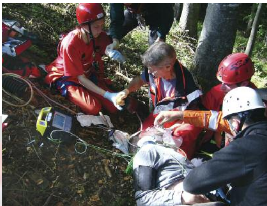
Die medizinischen Anforderungen an die Bergretter in Hessen steigen. 2010 gab es den ersten Lehrgang „Grundausbildung Notfallmedizin“

Deutlich wurden die veränderten Wünsche und Vorstellungen der Zielgruppen. Notwendig ist, sich in die örtlichen Netzwerkstrukturen einzubringen und Lobbyarbeit zu starten. In einem Maßnahmenplan wurden erste konkrete Schritte vereinbart. Eine Vertiefung des Themas ist für die Fachtagung in 2011 geplant.