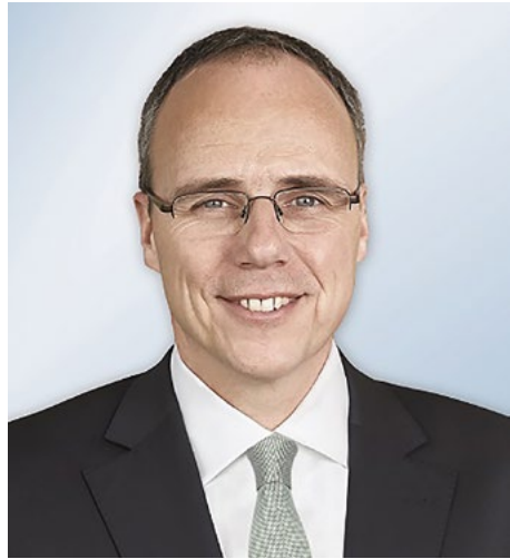
Peter Beuth Staatsminister Hessischer Minister des Innern und für Sport

Ich wünsche allen Teams einen sportlichen und fairen Wettstreit sowie viel Er-