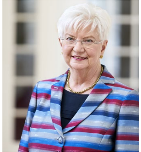
Gerda Hasselfeldt Präsidentin des Deutschen Roten Kreuzes e.V.

wünsche ich ein gutes Gelingen und viel Erfolg!