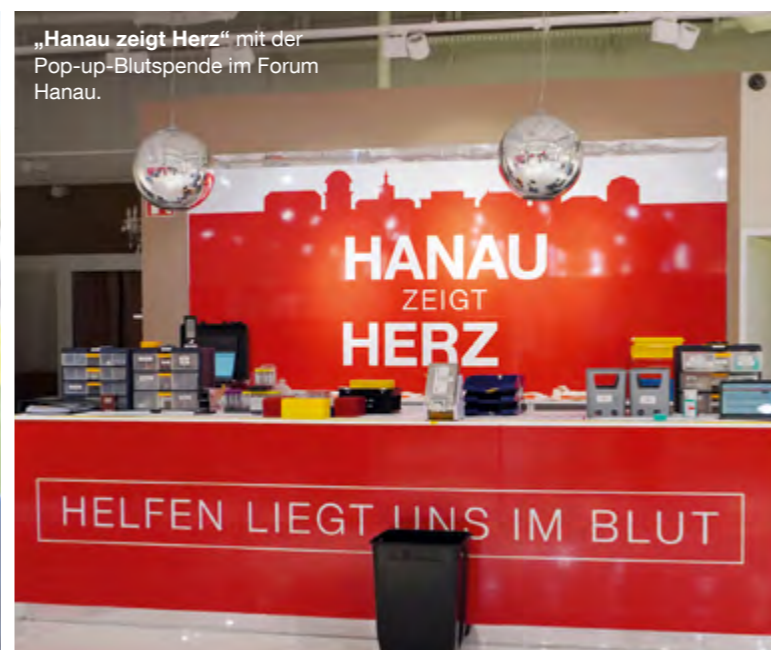
„Hanau zeigt Herz“ mit der Pop-up-Blutspende im Forum Hanau.