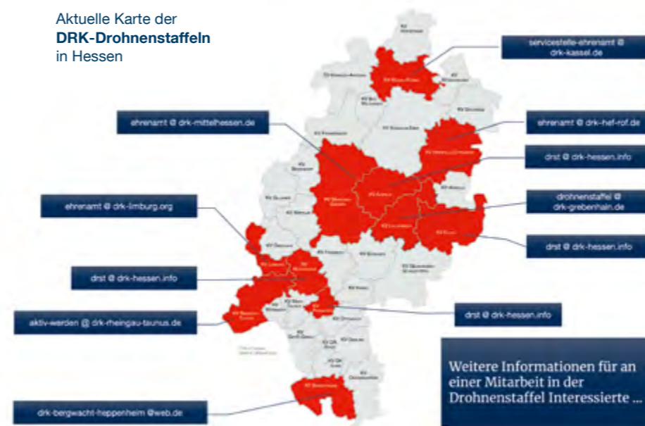
Aktuelle Karte der DRK-Drohnentaffeln in Hessen

Um diesen entsprechend zu begegnen, wurde ein fundiertes Ausbildungskonzept entwickelt und umgesetzt. Ergänzend dazu beteiligt sich der DRK-Landesverband sehr aktiv an den bundesweiten Aktivitäten des Generalsekretariats zum Thema Drohnen.