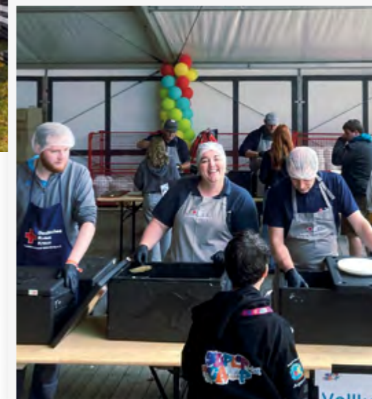
Mit Engagement und einem Lächeln im Einsatz für die Supercamp-Gäste: Die hessischen Helferinnen und Helfer an einer der Verpflegungsstationen.

der Verpflegung von 3.500 Polizeieinsatzkräften im Zeitraum vom 25. November bis zum 01. Dezember im Raum Gießen gebeten wurden.