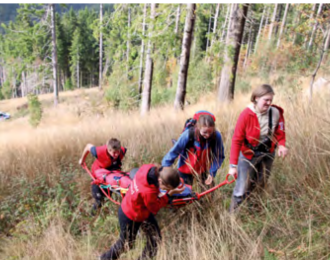
Übung macht stark: Bei Aktionen im Gelände lernen die Jugendlichen Funk, Orientierung und Erste Hilfe – engagiert, motiviert und mit viel Spaß dabei.

Um die Qualität der Jugendarbeit weiter zu stärken, fanden neben dem jährlichen Gruppenleiterlehrgang zahlreiche Fortbildungen statt. Sie umfassten Themen wie Kindeswohlgefährdung, rechtliche Grundlagen, Zusammenarbeit mit Eltern, Diversität in der Jugendarbeit, Datenschutz und Lebensmittelhygiene. Mit einem Mitgliederzuwachs von 17 Jugendlichen blickt die Bergwacht Jugend Hessen stolz auf das vergangene Jahr zurück – und optimistisch nach vorn. Auch 2026 wollen sie weiter wachsen, junge Menschen begeistern und den starken Zusammenhalt innerhalb der Jugendgruppen weiter ausbauen.