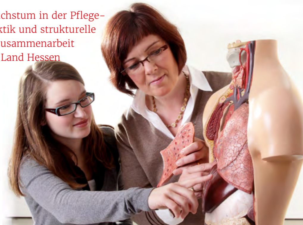
Moderne Pflegeausbildung in der Praxis: Am RotkreuzCampus Kronberg lernen Auszubildende mit innovativen Methoden und viel Praxisbezug – gemeinsam mit engagierten Lehrkräften und starken Partnern.

Inhaltlich standen die Weiterentwicklung von Unterricht und Methodik im Fokus. Fallbasiertes Lernen, Simulationen und reflektierende Lernphasen stärkten Handlungs-