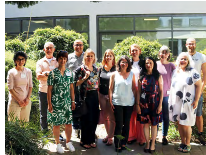
Ein Teil der hessischen MBE Beraterinnen bei der Fachtagung Süd im Juni vergangenen Jahres . Der Fachtag, zu dem der Bundesverband eingeladen hatte, diente dem fachlichen Austausch, der Vernetzung sowie der Information und wurde durch verschiedene Workshops ergänzt

FOKUS-THEMEN Neues Hauptaufgabenfeld | Stärkung von Ehrenamt und Übergängen in Regelangebote | Mehr Repräsentation im Verband