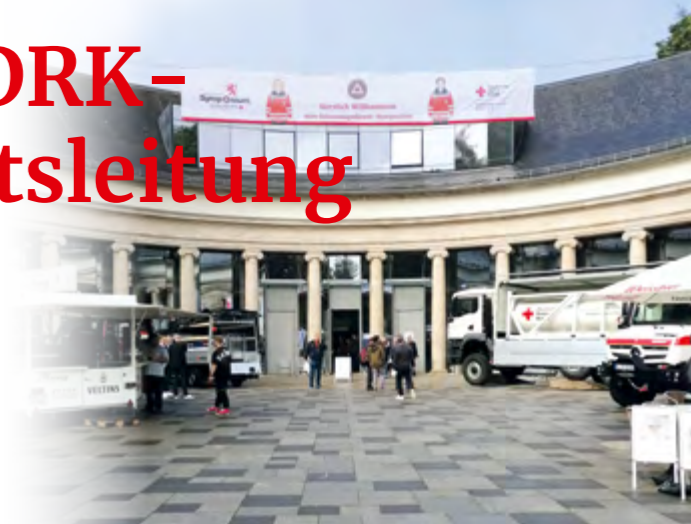
Das Außengelände des 2. Betreuungsdienst-Symposiums 2025 in Bad Wildungen: Ein zentraler Treffpunkt für Austausch und Fachdiskussionen für die 300 Gäste.

Strukturell wurde 2025 viel bewegt: Die Ordnung zum Schutz vor Sexualisierter Gewalt wurde angepasst und bietet den Bereitschaften nun ein klares und wirksames Handlungsinstrument. In der DRK-Lan-