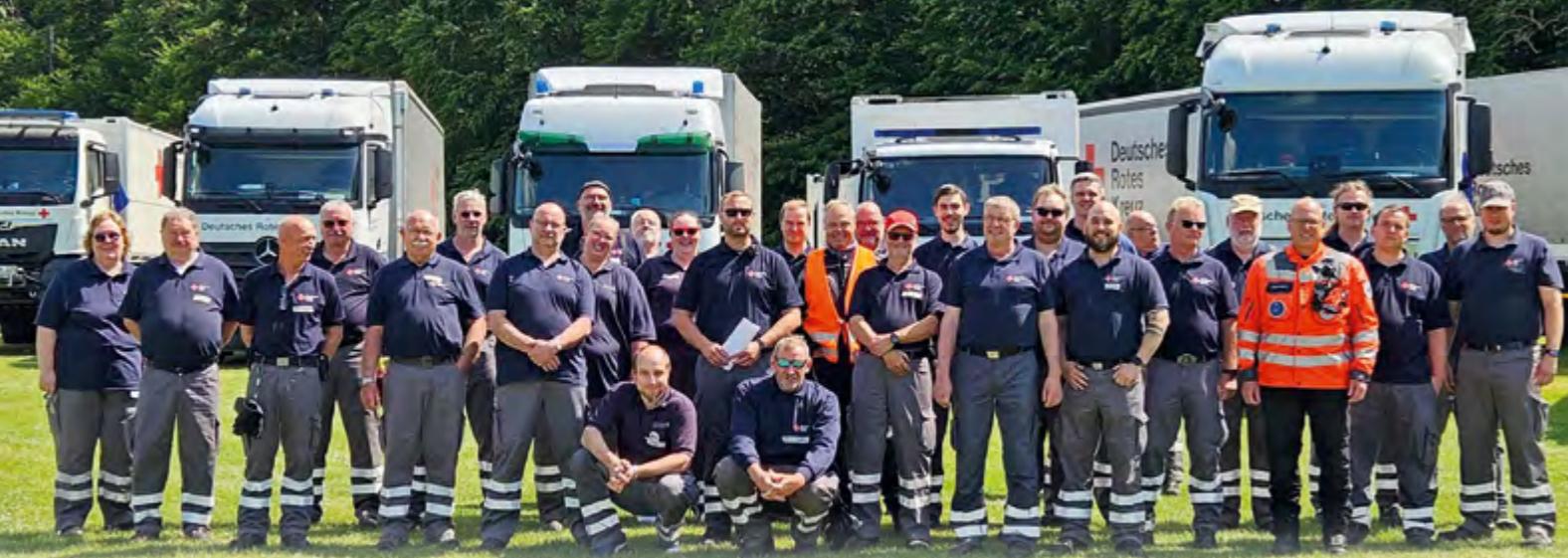
Mit vollem Einsatz dabei: Die hessische DRK-Mannschaft auf dem Zeltplatz „Alpha One“ bei Hameln – ein starkes Team, das maßgeblich zum Erfolg des JRK-Supercamps beigetragen hat.