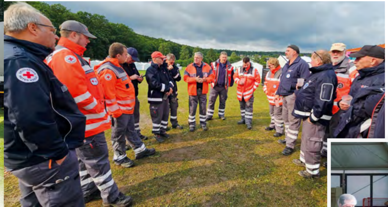
Dank regelmäßiger Lagebesprechungen direkt auf dem Zeltplatz verliefen Auf- und Abbau strukturiert und reibungslos.