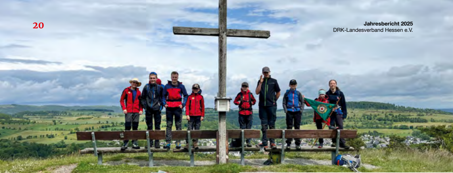
Gemeinsam draußen unterwegs: Die Bergwacht Jugend Hessen trainiert Rettungstechniken, stärkt Teamgeist und erlebt die Natur hautnah.