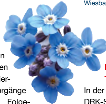
Symbol der Hoffnung anlässlich des Internationalen Tag der Vermissten

ren Aufgabe. Die ausgewiesenen Zahlen beziehen sich in allen Bereichen auf dokumentierte Beratungsvorgänge einschließlich Folgekontakte und bilden die Beratungsaktivität ab, nicht die Anzahl einzelner Fälle. Weiterentwicklung und Vereinheitlichung von Standards Die Entwicklungen im Jahr 2025 zeigten zudem eine kontinuierliche Optimierung der internen Arbeitsabläufe und Beratungsstandards. In einem standortübergreifenden Workshop mit allen Suchdienstberatungsstellen wurden Standards weiterentwickelt und für eine einheitliche, qualitätsgesicherte Beratung abgestimmt.