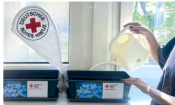
Vergissmeinnicht-Aktion zum Internationalen Tag der Vermissten am 30. August in Wiesbaden.

Im Dezember fand erstmals die achtstündige Qualifizierung „Ärztliche Mitwirkung im DRK“ statt. Sie richtet sich an Ärztinnen und Ärzte sowie Studierende in den letzten drei Semestern und vermittelt einen kompakten Überblick über die Aufgaben des DRK in Hessen und die Schnittstellen ärztlicher Mitwirkung. Für 2026 sind bereits zwei weitere Termine geplant.