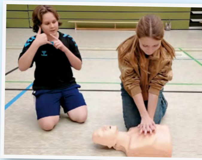
Hessen führt als erstes Bundesland verpflichtenden Wiederbelebungunterricht in der 7. Klasse ein.

Nach einer erfolgreichen Pilotphase mit 30 Schulen nehmen seit dem Schuljahr 2024/2025 bereits 180 Schulen teil; bis 2027 sollen alle weiterführenden Schulen folgen. Gemeinsam mit der Björn Steiger Stiftung und der Deutschen Herzstiftung werden Lehrkräfte durch Materialien, eine Lernplattform und Praxismodule unterstützt. Ziel ist es, Ängste abzubauen und lebensrettende Kompetenzen dauerhaft in der Gesellschaft zu verankern.