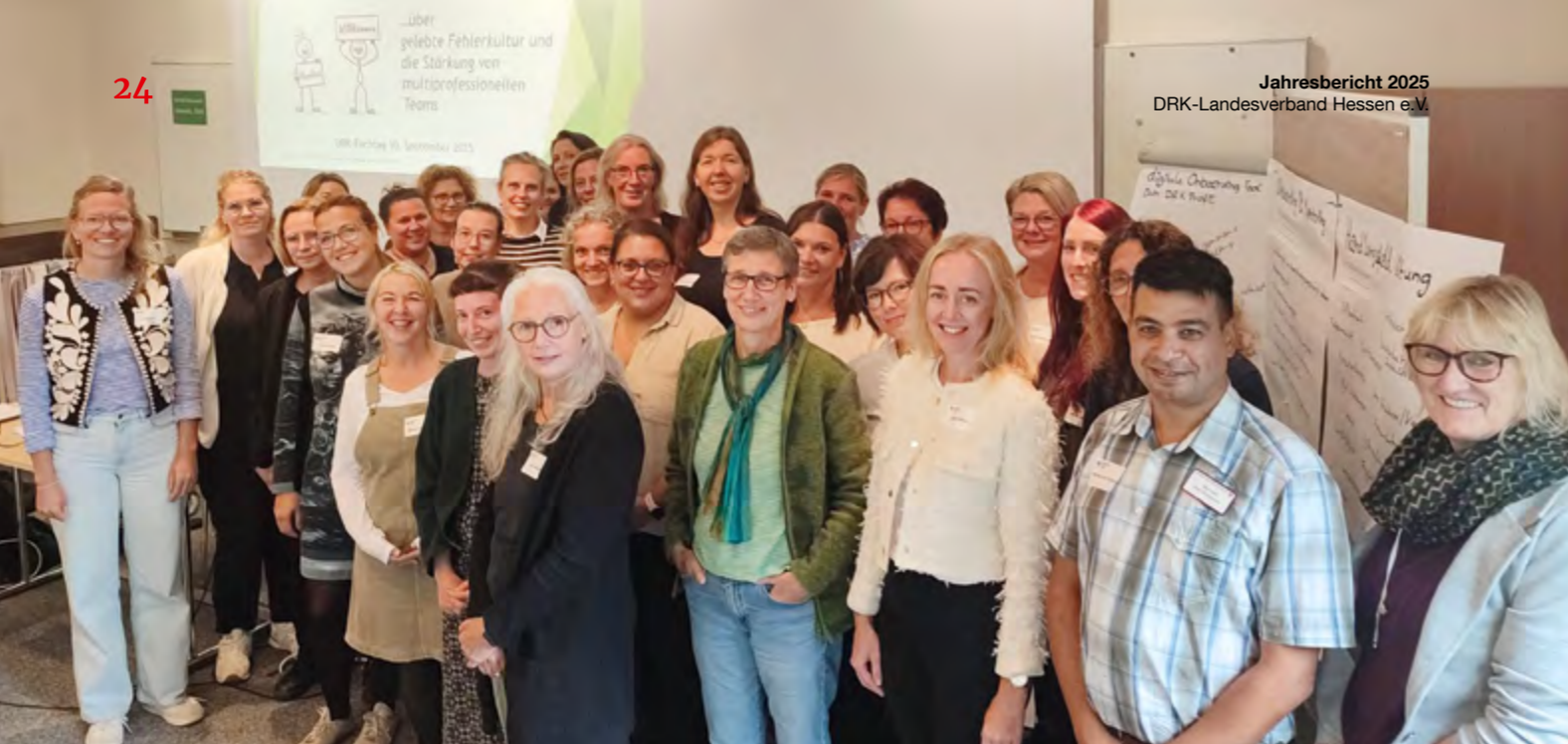
Über 30 Führungs- und Leitungskräfte trafen sich im September 2025 zum Fachtag Kinder- und Jugendhilfe in Grünberg