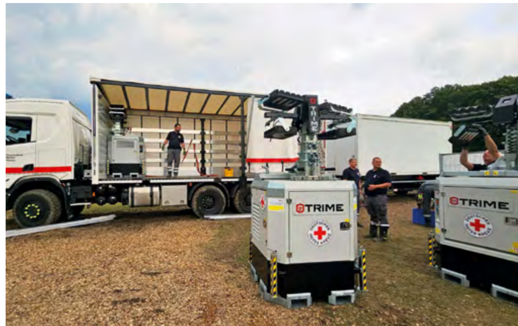
Entladung des tonnenschweren Materials.

Am 24. Oktober erreichte uns eine Anfrage der Hessischen Polizei, bei der wir um Unterstützung bei