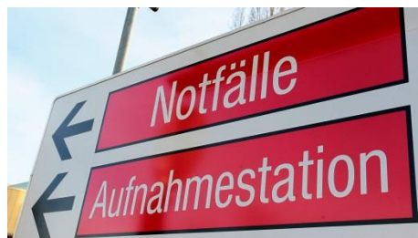
Traditionelles System Anbieter- und sektororientiert