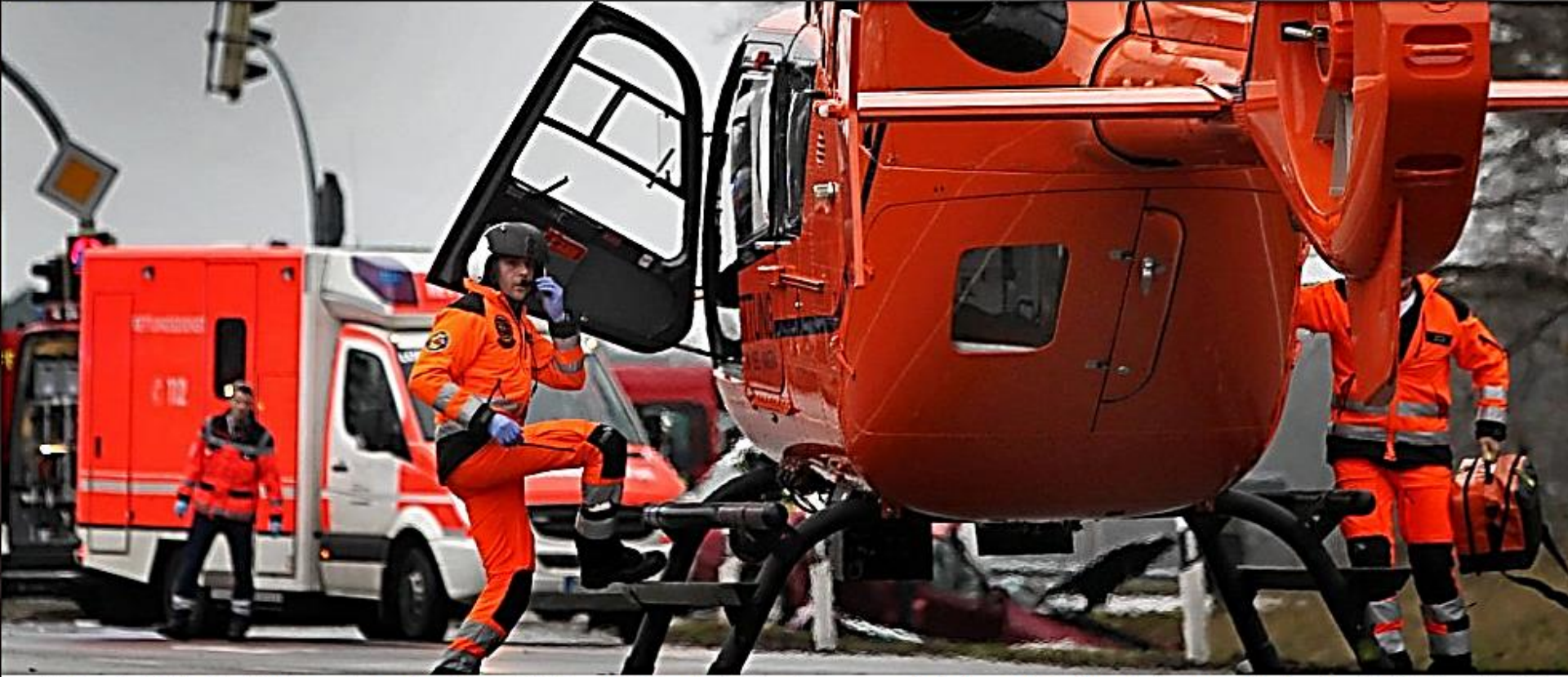
Schnelle Hilfe: Der Rettungshubschrauber „Christoph 13“ und ein Krankenwagen bei einem Unfall im Außenbereich der Stadt Bielefeld. 1.482-mal wurde der Helikopter im vergangenen Jahr angefordert.